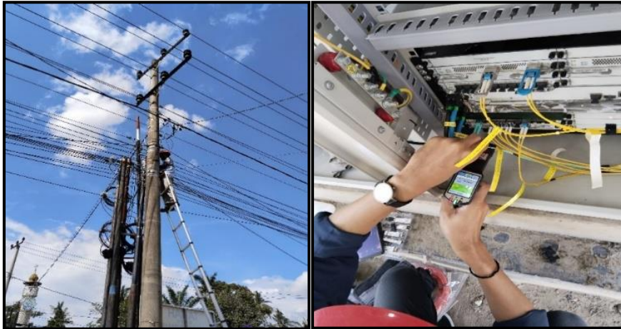
Gambar 1: Penarikan Kabel dan Pengecekan OLT KWH

rusaknya reputasi perusahaan, adanya gangguan operasional, dan turunnya moral pekerjaan. Gambar 1 merupakan salah satu pekerjaan PM yaitu penarikan kabel dan pengecekan OLT KWH.