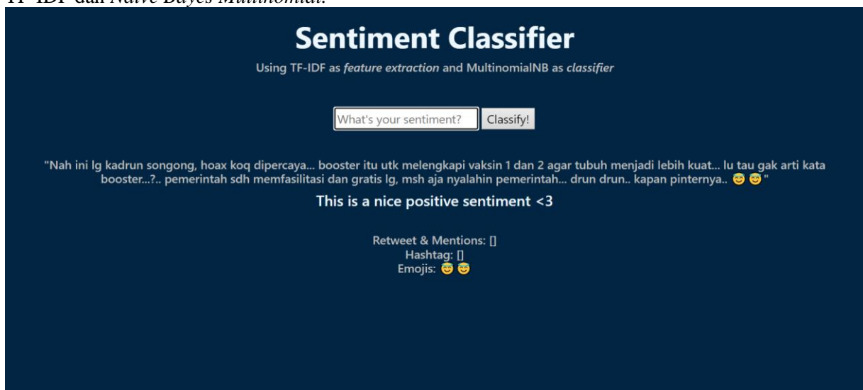
Gambar 3: Tampilan Setelah Submitting

Tampilan awal web , pada Gambar 2, menampilkan judul web dan form untuk menginput sentimen secara langsung. Selain itu ditampilkan juga metode yang digunakan dalam proses klasifikasi sentimen, yaitu TF-IDF dan Naive Bayes Multinomial .