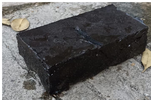
Gambar 4. Hasil Paving block

Sampah plastik dengan jenis LDPE yang berupa kemasan makanan, label plastik, dll dimasukkan melalui bagian atas drum yang telah berisi oli bekas hasil lelehan kemudian dicampur dengan bahan baku lainnya sesuai dengan metode pada Bab 2. LDPE merupakan jenis termoplastik yang dapat berubah fase jika diberikan perlakuan panas dan dibentuk kembali sesuai dengan kebutuhan (Sari, 2018). Penambahan oli berguna untuk meminimalisir gaya gesekan serta berperan sebagai pelumas pada proses pembakaran (Yuliaji et al., 2022). Pada proses pelelehan plastik dapat juga digunakan minyak jelantah karena minyak jelantah memiliki titik didih yang rendah sehingga waktu peleburan plastik menjadi lebih singkat (Hidayati et al., 2017). Adonan yang sudah siap kemudian dituang ke dalam cetakan seperti yang terlihat pada Gambar 3. Proses tekan digunakan untuk memadatkan adonan. Tingkat kepadatan produk akan mempengaruhi kekuatan dan karakteristik paving block yang dihasilkan. Proses pressing yang dilakukan masih manual sehingga menyebabkan tingkat kepadatan yang dihasilkan bergantung pada kekuatan penekanan yang dilakukan oleh individunya.