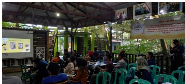
Gambar 5. Peserta Mengikuti Kegiatan Sosialisasi

Sosialisasi dilakukan setelah alat pelebur plastik dan uji coba pembuatan paving block selesai dilaksanakan. Tema yang diangkat pada kegiatan sosialisasi ini adalah isu lingkungan khususnya masalah sampah plastik serta cara pembuatan paving blok . Kegiatan ini dihadiri oleh mitra dan komunitas dari Program Kampung Iklim Balikpapan (PROKLIM). Dokumentasi kegiatan sosialisasi dapat dilihat pada Gambar 5 dan 6. Edukasi ini diharapkan dapat menjadi salah satu Langkah untuk menggerakkan Masyarakat sekitar wilayah mangrove untuk lebih peduli terhadap lingkungan, serta juga dapat meningkatkan kesadaran pengunjung akan pentingnya menjaga kelestarian lingkungan dengan tidak membuang sampah sembarangan terutama di area Wisata Mangrove Balikpapan.