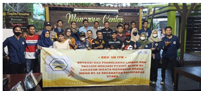
Gambar 6. Penutupan Kegiatan Sosialisasi

Sosialisasi dilakukan setelah alat pelebur plastik dan uji coba pembuatan paving block selesai dilaksanakan. Tema yang diangkat pada kegiatan sosialisasi ini adalah isu lingkungan khususnya masalah sampah plastik serta cara pembuatan paving blok . Kegiatan ini dihadiri oleh mitra dan komunitas dari Program Kampung Iklim Balikpapan (PROKLIM). Dokumentasi kegiatan sosialisasi dapat dilihat pada Gambar 5 dan 6. Edukasi ini diharapkan dapat menjadi salah satu Langkah untuk menggerakkan Masyarakat sekitar wilayah mangrove untuk lebih peduli terhadap lingkungan, serta juga dapat meningkatkan kesadaran pengunjung akan pentingnya menjaga kelestarian lingkungan dengan tidak membuang sampah sembarangan terutama di area Wisata Mangrove Balikpapan.