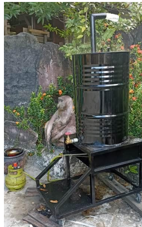
Gambar 2. Alat pelebur plastik

Pemanfaatan sampah plastik sebagai agregat pengganti pasir dapat dilakukan karena plastik memiliki kandungan air yang rendah kurang dari 2% (Kader et al., 2021). Proses pemanfaatan limbah plastik ini sekaligus upaya pemberdayaan Masyarakat yang berada disekitar Kawasan Wisata Mangrove Graha Indah mengingat pengolahan paving block ini dapat menjadi potensi pendapatan tambahan jika ditekuni lebih lanjut.