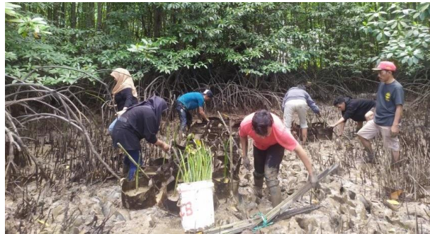
Gambar 7. Penanaman Bibit Mangrove

Rangkaian kegiatan pengabdian kepada Masyarakat dilengkapi juga dengan turut serta bergabung dalam acara pelestarian hutan mangrove dalam rangka memperingati hari lingkungan hidup yang jatuh setiap tanggal 5 Juni. Kegiatan penanaman bibit mangrove ini dilakukan bersama dengan pihak Mangrove Centre , Masyarakat, serta relawan Garuda seperti yang dapat dilihat pada Gambar 7.