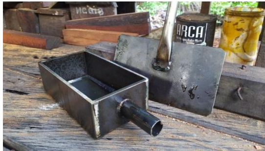
Gambar 3. Cetakan Paving block

Tahap pertama adalah perancangan alat pelebur plastik sederhana yang berfungsi untuk memanaskan sampah plastik agar plastik meleleh dan berubah fase menjadi cair. Alat pelebur plastik yang dirancang dapat dilihat pada Gambar 2. Tempat pelebur plastik berupa drum yang dilengkapi dengan keran dibagian bawah untuk mengalirkan hasil leburan plastik dalam fase cair.