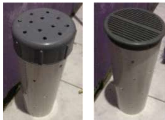
Gambar 3. Pipa Paralon dan Penutup Pipa

Bahan yang dibutuhkan untuk mengisi LBR yaitu sampah organik rumah tangga, berupa dedaunan, sisa makanan, kulit buah dan lain-lain. Pembuatan lubang biopori terdiri dari beberapa tahapan, sebagai berikut: