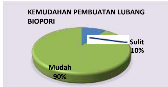
Diagram 3. Kemudahan Pembuatan LBR

Setelah melakukan penyampaian materi serta pelatihan pembuatan LBR, peserta memberikan tanggapan terkait potensi lubang infiltrasi biopori untuk diterapkan sebagai upaya penanganan banjir. Berdasarkan hasil kuisisioner, sebesar 90% responden mengaku bahwa LBR mudah untuk diterapkan, sebagaimana terlihat pada diagram berikut: