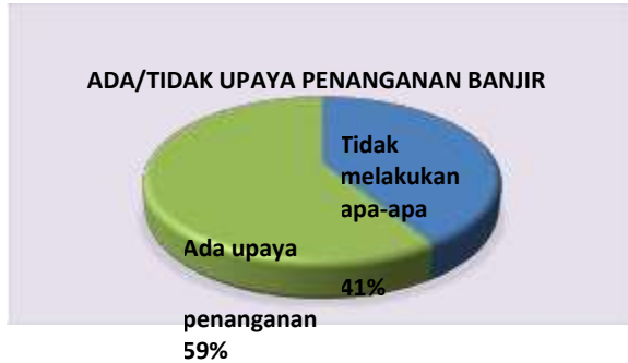
Diagram 2. Upaya Penanganan Banjir

Berdasarkan kejadian banjir di atas, penanganan banjir yang dilakukan oleh masyarakat dalam hal ini peserta kegiatan, yaitu: