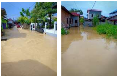
Gambar 1. Kondisi Banjir Perumahan Sosial

Pelaksanaan kegiatan ini didasari oleh fakta bahwa wilayah perumahan ini memiliki kerentanan yang tinggi akan banjir, karena merupakan wilayah cekungan (Ketua RT 28, Kelurahan Batu Ampar). Berkali-kali terkena banjir setiap hujan deras, masyarakat Perumahan Sosial sangat mengharapkan bantuan pemerintah untuk menangani permasalahan ini ( http://kaltim.tribunnews.com , 2018). Kondisi geografis wilayah rawan banjir yang dimanfaatkan sebagai wilayah permukiman, memberikan potensi penanggulangan banjir berbasis masyarakat dengan pengaplikasian skala rumahan.