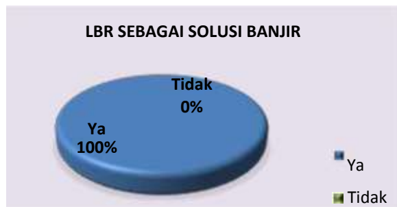
Diagram 4. Persepsi Responden tentang LBR sebagai Upaya Mengatasi Banjir

Setelah mendapatkan sosialisasi dan pelatihan pembuatan lubang infiltrasi biopori, responden setuju bahwa teknologi sederhana ini dapat dijadikan sebagai solusi untuk menangani risiko banjir pada lingkungan perumahan, khususnya di Kelurahan Batu Ampar.