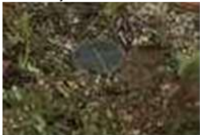
Gambar 5. Lubang Resapan Biopori yang telah selesai dan terisi sampah organik