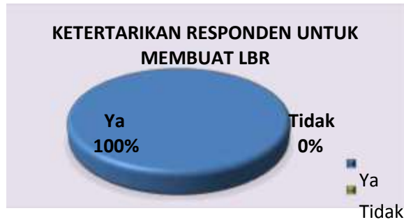
Diagram 4. Persepsi Responden tentang LBR sebagai Upaya Mengatasi Banjir

alat dan bahan yang tidak sulit didapatkan.