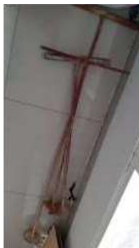
Gambar 2. Alat Bor Tanah (panjang 100 cm; diameter 10 cm)

Setelah menemukan lokasi yang tepat, tahapan selanjutnya adalah mempersiapkan alat dan bahan untuk pembuatan lubang biopori. Alat yang perlu dipersiapkan yaitu alat bor tanah (dengan panjang 100 cm atau lebih), pipa paralon yang telah dilubangi sepanjang 10 – 30 cm dan penutup lubang, untuk menjaga agar nantinya lubang tidak tertutupi oleh tanah.