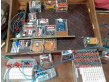
Gambar 6. Implementasi Pada Sistem Komunikasi

menggunakan 1 modul untuk mewakili dari berbagai IC. Selain itu modul ini juga dapat saling terintegrasi membentuk rangkaian sesuai dengan tujuan penggunaan dalam menggabungkan berbagai macam gerbang logika.