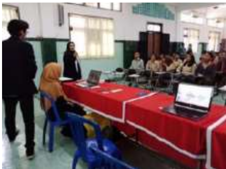
Gambar 3. Penyampaian Materi kepada Siswa oleh Mahasiswa

Penyampaian kepada siswa SMK oleh Mahasiswa dilakukan dengan pengenalan akan fungsi mikrokontroler dalam kehidupan sehari-hari dan tip dan trik sederhana dalam mempelajarinya, kegiatan tersebut seperti pada gambar 3.