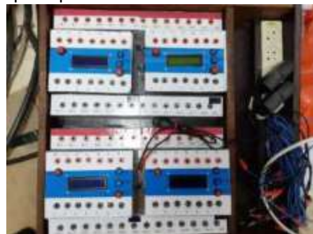
Gambar 5. Implementasi Pada Sistem Digital

Praktik digunakan untuk mengaplikasikan modul mikrokontroler arduino seperti pada gambar 5. Dimana modul-modul ini merupakan media pembelajaran dalam beberapa mata kuliah dalam sistem digital dan komunikasi yang dapat diterapkan pada sekolah-sekolah dan kampus.