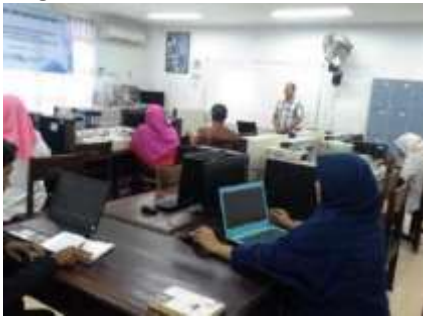
Gambar 2. Penyampaian Materi kepada Guru oleh Tim Dosen

Ceramah digunakan dalam proses penyampaian materi pelatihan, selain itu digunakan juga dalam memberikan pengarahan kepada mitra untuk meningkatkan penggunaan modul mikrokontroler seperti pada gambar 2. Pada metode ceramah penyampaian materi mikrokontroler terbagi menjadi 2 bagian, pertama dasar dalam memahami mikrokontroler seperti arsitektur dan fungsi dari input dan output. Kedua yaitu pemahaman akan struktur pemrograman dasar dalam membangun sistem tertanam