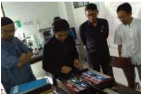
Gambar 7. Praktik Pada Guru SMK

Pada gambar 6, Implementasi mikrokontroler yang diintegrasikan dengan sistem komunikasi. Tujuan dari modul ini adalah untuk memahami akan fungsi dan peran komunikasi dalam sistem kendali untuk menunjang era industry 4.0. Setelah memahami akan fungsi dari modul yang dikenalkan maka para peserta pelatihan melakukan uji coba modul seperti pada gambar 7.