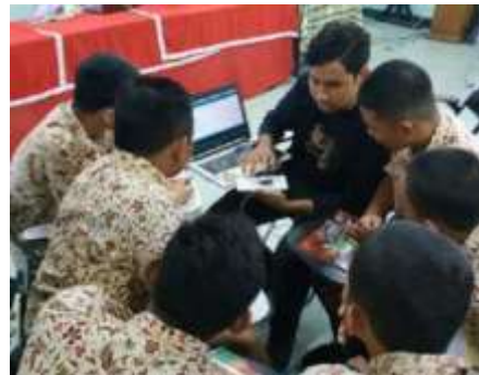
Gambar 4. Demonstrasi dan Praktik Pada Siswa

dalam memahami materi yang disampaikan. Kegiatan ini diawali dengan praktik dan contoh sederhana seperti cara pemrograman mikrokontroler ke media. Hasil demonstrasi akan menggambarkan implementasi dari aplikasi nyata yang terdapat pada kehidupan sehari-hari, seperti lampu lalu lintas, indikator kondisi udara, dan lainnya. Demonstrasi dilakukan seperti pada gambar 4.