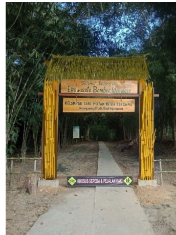
Gambar 3. Hasil Desain Gerbang dan Spot Foto