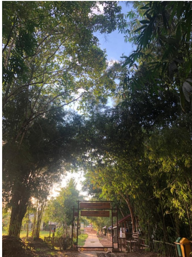
Gambar1: Gerbang Desa Bamboo kampung pati. 2021

Kegiatan ini merupakan salah satu bentuk mengembangkan potensi yang dimiliki masing-masing daerah seperti kota Balikpapan. Sebagai salah satu daerah yang dikenal dengan kota minyak yang struktur perekonomiannya sangat didukung penuh oleh kekayaan alam yang dimiliki kota Balikpapan. Kampung Bambu Desa Pati adalah salah satu destinasi wisata Bamboo yang masih baru didengar oleh masyarakat Kalimantan terutama Balikpapan, desa ini terletak di Kampung Pati, Jl. Giri Rejo, Kilometer 15, RT 26 Kelurahan Karang Joang, Balikpapan Utara (Balut). yang sangat mempunyai potensi pariwisatanya, Balikpapan memiliki potensi sumber daya pariwisata yang beraneka ragam, mulai dari atraksi wisata alam, atraksi wisata budaya dan atraksi wisata buatan manusia, yang didukung dengan kondisi lingkungan alam, lingkungan sosial budaya.