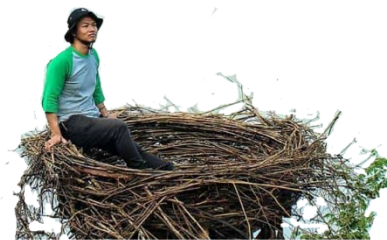
Gambar 4. Hasil desain Spot Foto Sangkar Burung