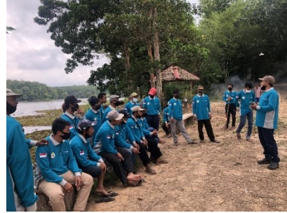
Gambar 2. Pelatihan kepada warga Desa Bamboo Wanadesa