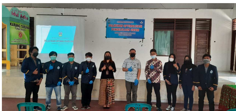
Gambar 6. Foto Bersama Tim KKN ITK dengan Lurah Prapatan

mendapatkan insight dari sosial media untuk mengetahui trend pasar di masyarakat melalui facebook insight , instagram insight , google trends dan google analytics . Materi akhir tentang manajemen keuangan juga sangat berpotensi untuk terus dilanjutkan di masyarakat. Hal ini dikarenakan besarnya atensi masyarakat di Kelurahan Prapatan tentang pentingnya proses manajemen keuangan di UMKM Kelurahan Prapatan agar masyarakat mengetahui pengelolaan modal usaha dan keuntungan sehingga usaha dapat bertahan. Selain itu, output dari seluruh rangkaian kegiatan KKN yaitu telah berhasil menghasilkan Instagram (IG) UMKM yang kontennya berisi promosi produk, informasi produk, foto-foto, dan lainnya.