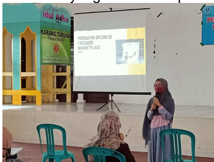
Gambar 4. Penyampaian Materi Digital Marketing

Facebook Marketplace. Pada sesi akhir pelatihan ini, masyarakat diberikan kesempatan untuk berdiskusi dan bertanya mengenai materi yang telah disampaikan.