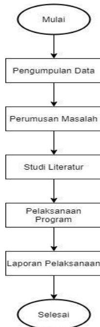
Gambar 1. Diagram Alir Pelaksanaan

Laporan pelaksanaan adalah laporan yang memberikan informasi mengenai pelaksanaan sebuah kegiatan yang sudah terlaksana. Tujuan dari laporan pelaksanaan digunakan untuk melaporkan keadaan atau proses selama pelaksanaan mengenai kegiatan yang dilaksanakan.