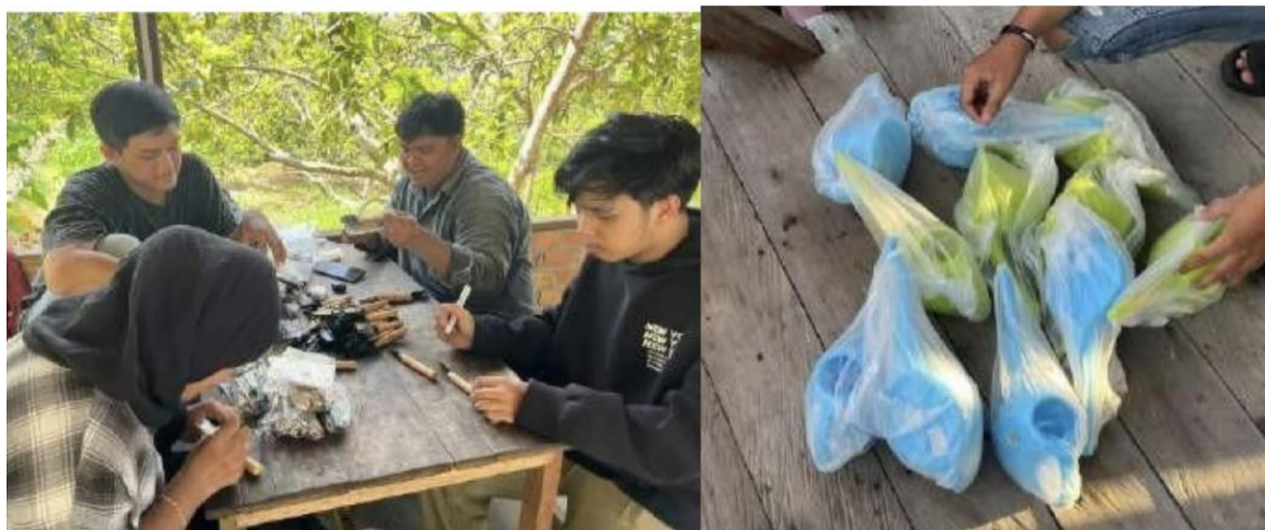
Gambar 3. Penyediaan Alat Berkebun untuk Anak Sekolah

Penyediaan alat-alat berkebun untuk anak sekolah dasar pada Wisata Edukasi Kebun Pak Agus merupakan langkah nyata dalam memberikan pengalaman belajar yang praktis dan edukatif bagi anak-anak. Kelompok kegiatan memiliki tanggung jawab untuk menyediakan alat-alat berkebun seperti sekop, garpu tanah, sarung tangan dan penyiram tanaman untuk kegiatan berkebun anak-anak di Kebun Pak Agus. Distribusi alat-alat berkebun dilakukan dengan tujuan untuk memberdayakan anak-anak dalam mengenal dunia pertanian, memahami proses penanaman tanaman, merawat tanaman serta meningkatkan kesadaran akan pentingnya keberlanjutan lingkungan. Manfaat dari kegiatan ini antara lain dapat mempermudah anak-anak dalam belajar caranya berkebun, meningkatkan kreativitas, dan juga meningkatkan minat anak-anak dalam belajar memahami tentang lingkungan dan keberlanjutan. Dengan demikian, penyediaan alat-alat berkebun untuk anak Sekolah Dasar pada Wisata Edukasi Kebun Pak Agus diharapkan dapat memberikan manfaat, tidak hanya untuk Kebun Agus namun dapat bermanfaat juga bagi para pengunjung.