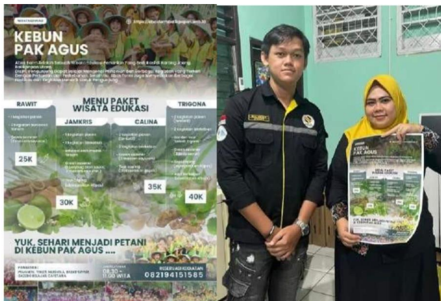
Gambar 6. Pembuatan Poster Branding

Poster branding adalah media visual yang dirancang khusus untuk memperkenalkan, mempromosikan dan memperkuat identitas suatu produk, layanan atau destinasi. Poster branding merupakan salah satu langkah strategis dalam memperkuat identitas dan citra destinasi wisata Kebun Pak Agus. Kelompok kegiatan bertanggung jawab untuk merancang, membuat, dan menyebarkan poster branding yang mencakup desain visual yang menarik, informasi yang informatif, serta pesan-pesan yang mendukung tujuan edukasi Kebun Pak Agus. Pembuatan poster branding bertujuan untuk meningkatkan visibilitas, kesadaran, dan daya tarik Kebun Pak Agus di mata pengunjung potensial. Manfaat dari adanya kegiatan ini adalah memperkuat identitas visual destinasi wisata Kebun Pak Agus, meningkatkan daya tarik pengunjung, serta memberikan informasi yang jelas dan menarik mengenai kegiatan dan nilai-nilai edukasi yang ditawarkan oleh Kebun Pak Agus. Selain itu, poster branding juga dapat menjadi alat promosi yang efektif untuk menjangkau khalayak yang lebih luas dan memperkenalkan destinasi wisata kepada masyarakat luas.