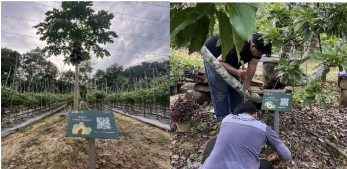
Gambar 4. Pemasangan Penanda Tanaman

Pembuatan penanda tanaman pada Wisata Edukasi Kebun Pak Agus merupakan inisiatif yang bertujuan untuk meningkatkan pengalaman belajar dan interaksi pengunjung, khususnya anak-anak, dengan berbagai jenis tanaman yang ada di kebun. Kelompok kegiatan bertanggung jawab untuk merancang, membuat, dan memasang penanda tanaman yang informatif dan menarik di sekitar tanaman yang ada. Pembuatan penanda dilakukan sebanyak 10 (sepuluh) buah yang terdiri dari jambu kristal, jambu air, tomat, cabai rawit, pepaya, kelengkeng, alpukat, pare, sirsak, dan kacang panjang. Penanda tersebut berisi informasi nama tanaman, nama latin serta barcode yang akan langsung menuju website yang berisi informasi penting tentang tanaman yang bersangkutan, seperti manfaat, ciri-ciri morfologi, dan informasi lainnya yang dapat memberikan edukasi kepada pengunjung, terutama anak-anak, tentang keanekaragaman tanaman dan kegunaannya. Manfaat yang dapat diberikan dari kegiatan ini, antara lain meningkatkan pemahaman dan pengetahuan pengunjung tentang flora lokal, mempermudah identifikasi tanaman, memberikan pengalaman belajar yang interaktif dan menyenangkan, serta meningkatkan kesadaran akan pentingnya pelestarian lingkungan dan keberlanjutan sumber daya alam. Dengan adanya penanda tanaman yang informatif dan edukatif, pengunjung dapat belajar sambil bermain dan menikmati keindahan alam, sehingga menciptakan pengalaman wisata edukasi yang berkesan dan bermanfaat.