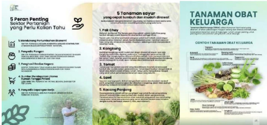
Gambar 5. Pembuatan Poster Edukasi