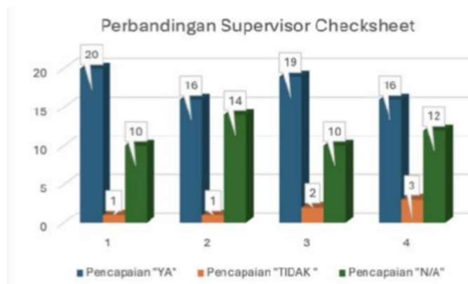
Gambar 1. Perbandingan Supervisor Checksheet

Hasil analisis supervisor checksheet menunjukkan bahwa rata-rata tingkat kepatuhan pekerja sebesar 94.35%. Hal ini menunjukkan bahwa implementasi prosedur keselamatan kerja pada pekerjaan ground disturbance telah berjalan dengan cukup baik. Namun demikian, masih ditemukan beberapa indikator yang menunjukkan ketidakpatuhan dalam pelaksanaannya. Adapun perbandingan dari keempat pekerjaan tersebut adalah sebagai berikut: