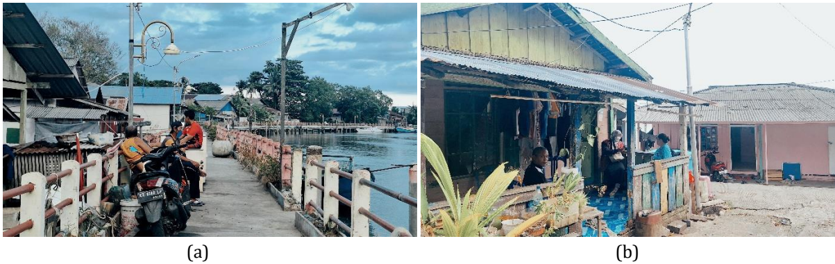
Gambar 2a (kiri). Kondisi Jaringan Sosial Antar Individu Masyarakat Kampung Warna-Warni Teluk Seribu Gambar 2b (kanan). Kondisi Jaringan Sosial Antar Kelompok Masyarakat Kampung Warna-Warni Teluk Seribu