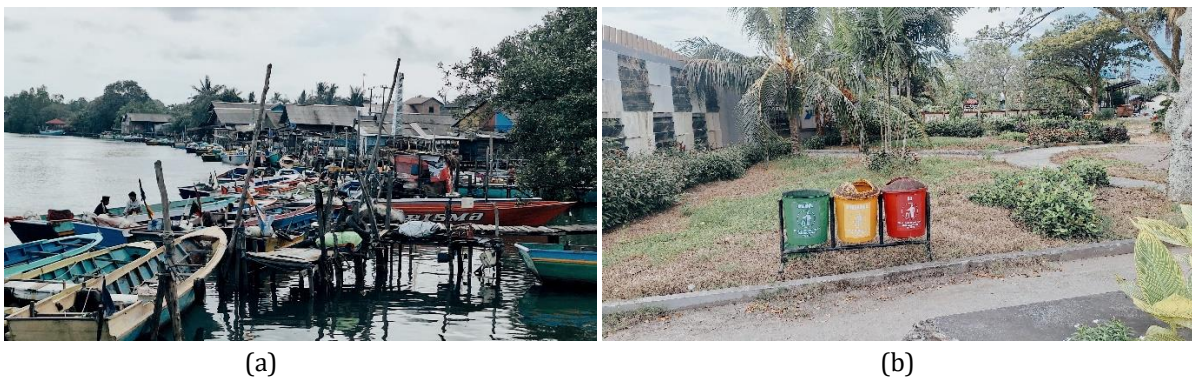
Gambar 4a (kiri). Kondisi Norma Sosial Masyarakat Kampung Warna-Warni Teluk Seribu Gambar 4b (kanan). Kondisi Norma Sosial Masyarakat Kampung Warna-Warni Teluk Seribu

menghormati keragaman tanpa memandang jenis kelamin, etnis, agama, status sosial, atau latar belakang lainnya.