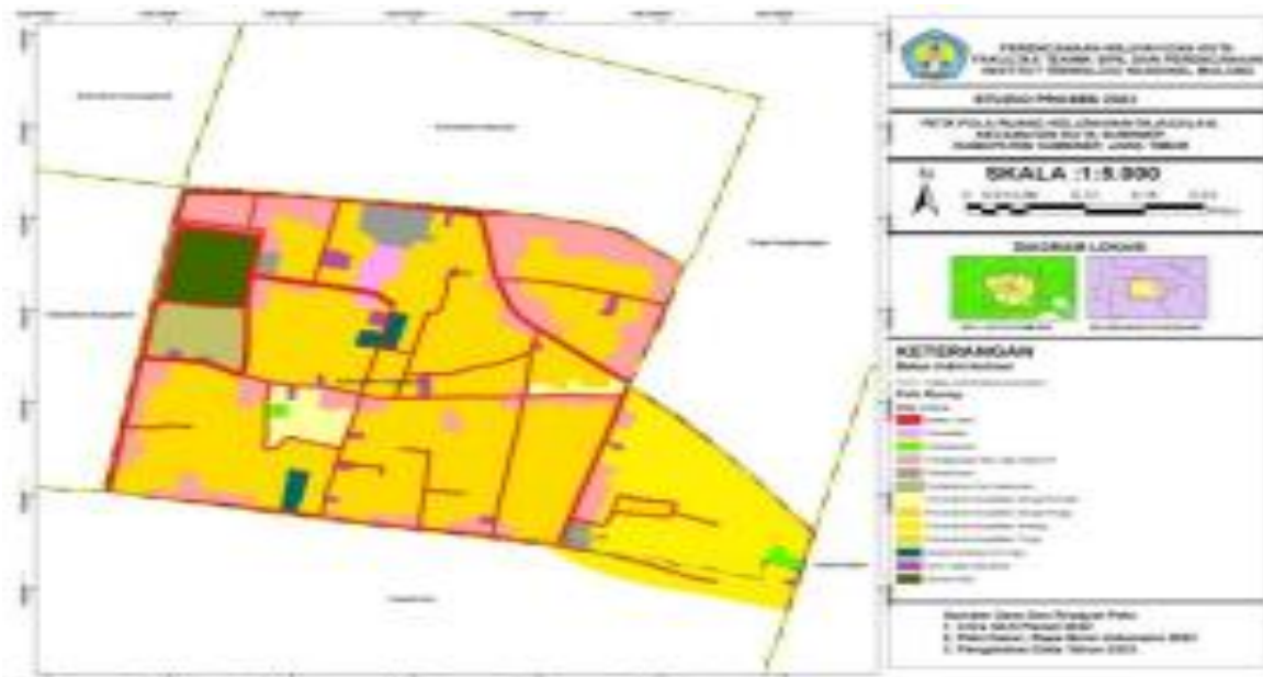
Gambar 1. Penggunaan Lahan Kelurahan Pejagalan